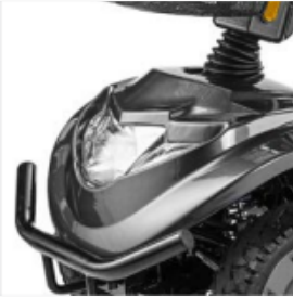
Dernière technologie LED