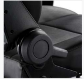
Siège de luxe réglable en continu