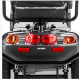
Moteur de 700/3000 watts