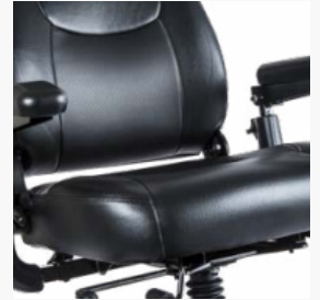
Système de siège confortable à suspension