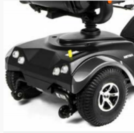
Moteur de 1 600 watts