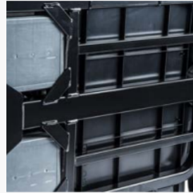
Cadre de cassette extrêmement robuste