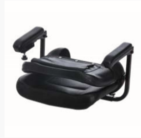
Zerlegbar in drei Teile