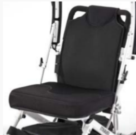
Système de sièges confort