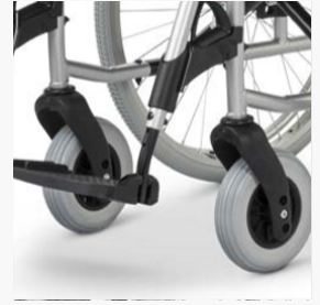
Voorste zithoogte aanpasbaar zonder wisselstukken