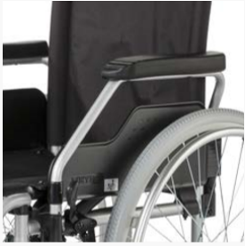
Comfortabele ontgrendelingsfunctie van de armsteunen