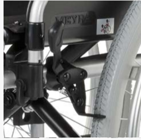
Frein à genouillère