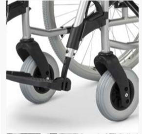
Vordere Sitzhöhe einstellbar ohne Teiletasch