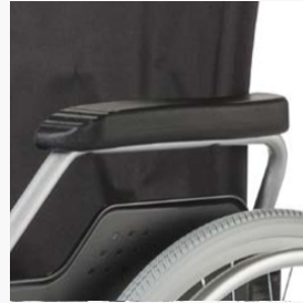
Verriegelbare Armlehnen nach hinten abklappbar