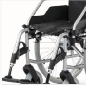
Zithoogte voor variabel