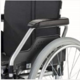
Zijpaneel met comfortverwijdering, in hoogte verstelbaar