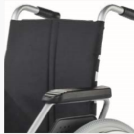
Verstelbare rugriem, in hoogte verstelbare duwhandvatten