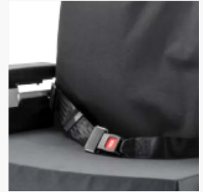
Ceinture de sécurité renforcée