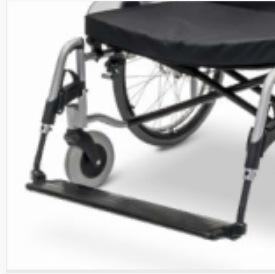
Panneau de pied continu