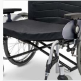
*Erhöhte Stabilität durch Verwendung einer Doppelschere