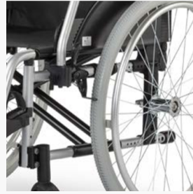
Verhoogde stabiliteit door gebruik van dubbel schaarsysteem