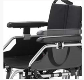
Hoogte instelbare armsteunen met diepte verstelbare armpolster, standaard