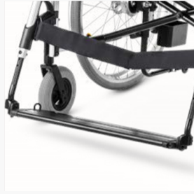
Panneau de pied continu