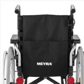
Anpassrücken in Serie