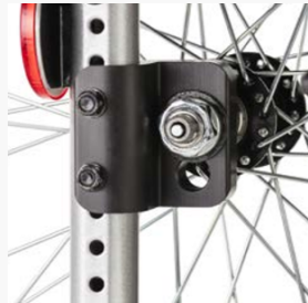
Radstandsverlängerung durch Drehen des Varioblockes nach hinten