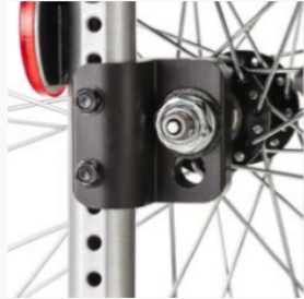
Rallongement de l'empattement en tournant le Varioblock vers l'arrière