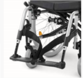
Repose-jambes amovibles, pivotants. Repose-pieds à angle réglable, y compris sangle de mollet individuelle