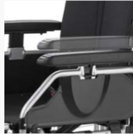
Höhenverstellbares Seitenteil mit tiefeinstellbarer Armauflage