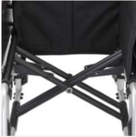
Doppelschere in Serie