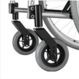
*Winkelverstellbarer Steuerkopf Alu Lenkgabel