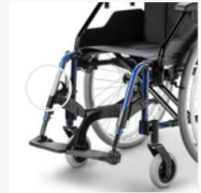
Beinstützen nach innen und außen abschwenkbar, 2 Rahmenfarben zur Auswahl