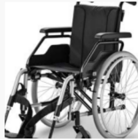
Umrüstung schnell und gezielt möglich ohne Teiletausch