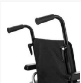
Hohe Variabilität durch Nachrüstsätze