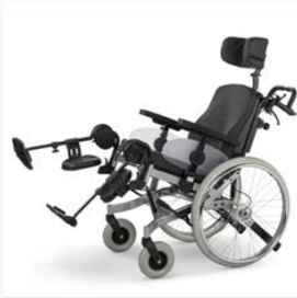
In jeder Hinsicht anpassungsfähig