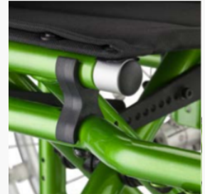
Superflexibel, ein Sitz, der mit dir wächst