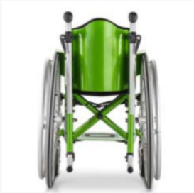
Anatomische Rückenschale, abnehmbar