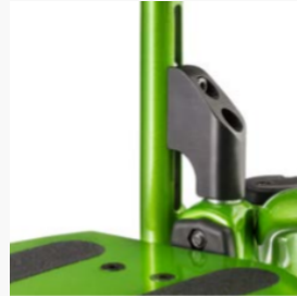
Perfekt einstellbare Unterschenkelänge