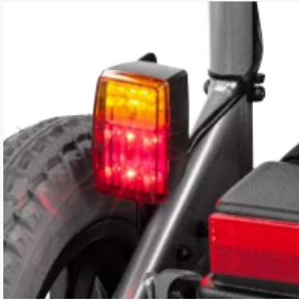
Long-lasting LED lighting available as an option