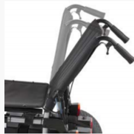
Réglage du dossier à 30° en option