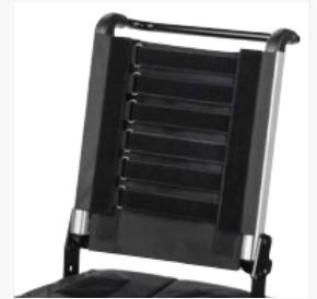
Siège et dossier adaptés