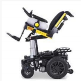
200 mm Sitzhub, Kantelung