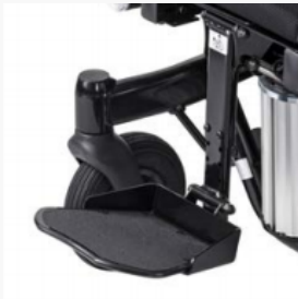
Zentrale Beinstütze, 90° Kniewinkel