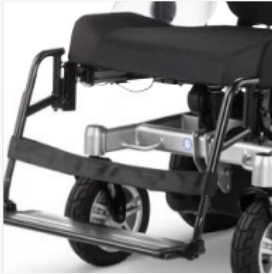
Höchste Stabilität durch verstärkte Komponenten