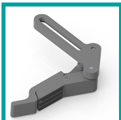
08 Code 2595