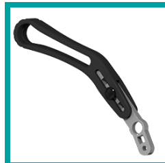
08 Code 681