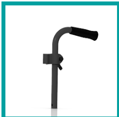
10 Code 502