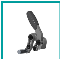
08 Code 652