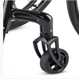
Raccordement des roues directrices