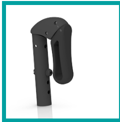
10 Code 141