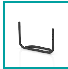
15 Code 311