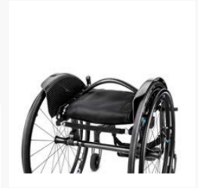
Dossier pliable de série