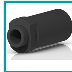
05 Code 447