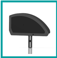
14 Code 100