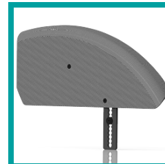
14 Code 783