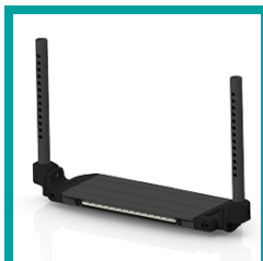
15 Code 4312