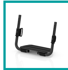
15 Code 312