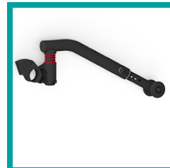
18 Code 729