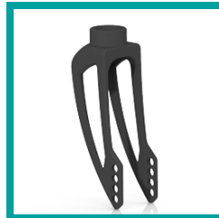
00 Code 419