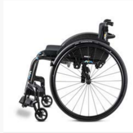
Un concept de châssis esthétique