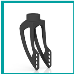
00 Code 418