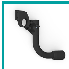
18 Code 4930