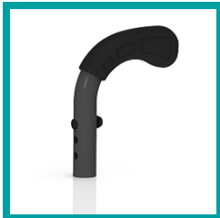
10 Code 410