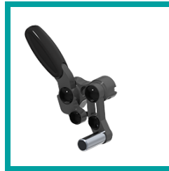
08 Code 305