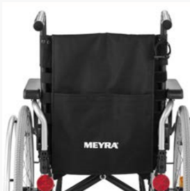
Anpassrücken in Serie