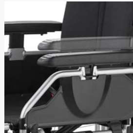
Höhenverstellbares Seitenteil mit tiefeinstellbarer Armauflage