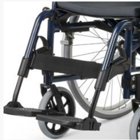
Beinstützen nach innen und außen abschwenkbar